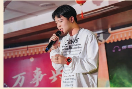
《After Journey》 东海学院学子 勇敢做自己