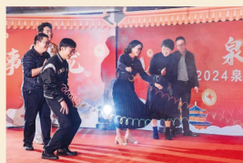
互动游戏 《诸葛帽吃糖》《光盘拔河》 欢乐不停 快乐不息