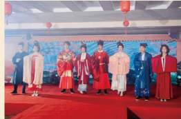
《国潮走秀》 集团员工 着华赏汉服，穿越千年繁华