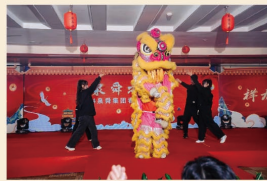
《精武狮门》 东海学院学子 新旧交融，让旧传统变得时尚

四十载风雨兼程路，积淀底蕴。四十年风华流转间，尽显风骨。愿泉舜人能领会吴董的创业之心，珍惜泉舜这份大家共同的事业，砥砺前行，再创新华章。