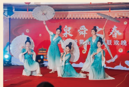
《国潮纸伞舞》 集团员工 唯美的艺术盛宴 感受传统与现代的完美结合