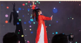
《科技秀》 东海学院学子 未来科技的视觉盛宴

新岁将至，飞驰的轮瞬间一跃已是一年，古雅风韵的国风签到，喜庆典雅的国潮主题氛围布置，精彩纷呈的节目表演，搞笑有趣的互动游戏，万众期待的抽红包等环节，抱着对来年的憧憬，我们用这样一场充满仪式感的晚会告别2023，拥抱全新的2024。