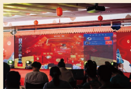
抽红包 万众期待 掀起欢乐的高潮